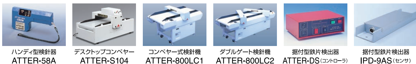
ハンディ型検針器 ATTER-58A デスクトップコンベヤー ATTER-S104 コンベヤー式検針機 ATTER-800LC1 ダブルゲート検針機 ATTER-800LC2 据付型鉄片検出器 ATTER-DS(コントローラ) 据付型鉄片検出器 IPD-9AS(センサ)