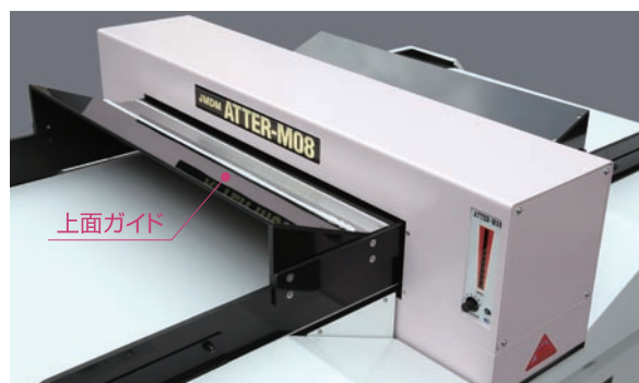
※写真の機種はATTER-M08です。